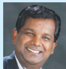
ധ്യാനം : 01

മാനസികമായ ഐക്യം അഥവാ പരസ്പരം പ്രയാസങ്ങൾ ഉണ്ടെങ്കിൽ അതിനു പരസ്പര ഐക്യം ഉണ്ടായിട്ടേ ദൈവത്തെ ആരാധിക്കാവൂ. എല്ലാറ്റിലും ഉപരിയായി തന്നെത്താൻ ദൈവസന്നിധിയിൽ ഒരുക്കപ്പെട്ടു ശുദ്ധീകരണത്തോടെ ഒരുങ്ങിവന്നു ആരാധിക്കുന്നവരുടെ ആരാധന മാത്രമേ ദൈവം സ്വീകരിക്കയുള്ളൂ. അല്ലാത്ത ആരാധനകൾ ഒന്നും ദൈവ വചനപ്രകാരം സുഗ്രഹഹൃദയമായ ആരാധന അല്ല. (തുടരും)