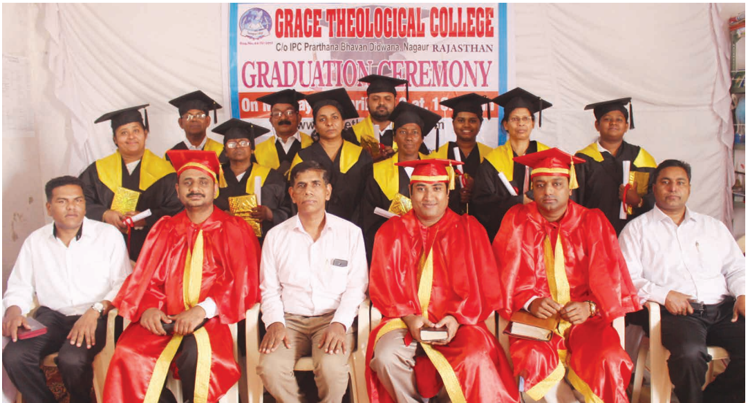
രാജസ്ഥാൻ ഗ്രേസ് സിന്റിയോളജിക്കൽ കോളേജിൽ ഗ്രാഡുവേഷൻ ചെയ്ത വിദ്യാർത്ഥികളും അദ്ധ്യാപകരും.