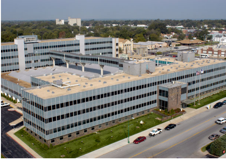
Assemblies of God International Headquarters, Springfield Missouri

New numbers released by the AG recently detail the multiple areas of growth from 2012 to 2013. The largest gain was made among water baptism, which rose 4.3%. Other notable statistics include the following: