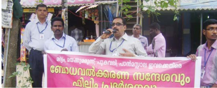
നെടുങ്കണ്ടം ചെക്കനായും കട്ടപ്പന സി.എഫ്.ഐ യും സംയുക്തമായി അഗളി ആദിവാസി മേഖലകളിൽ മദ്യത്തിനും മയക്കുമരുന്നിനുമെതിരെ ബോധവൽക്കരണ സന്ദേശവും ഫിലിം പ്രദർശനവും നടത്തി.