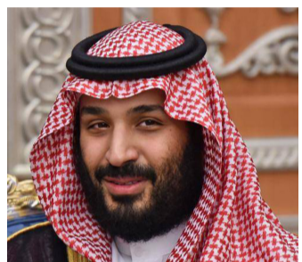
മുഹമ്മദ് ബിൻ സൽമാൻ ക്കാൻ അവകാശമുണ്ടെന്നു കരുതുന്നുണ്ടോ എന്ന് അറ്റാലാന്റിക് എഡിറ്റർ ഇൻ ചീഫ് ജെഫ്രി ഗോൾഡ്ബർഗ് ചോദിച്ചപ്പോഴാണ് സൽമാൻ രാജകുമാരന്റെ മറുപടിയുണ്ടായത്. യിസ്രായേൽ എന്ന രാജ്യം പുനസ്ഥാപിച്ചതായിപ്പോലും ഇതുവരെ സൗദി അറേബ്യ അംഗീകരിക്കാൻ തയ്യാറാകാത്ത സാഹചര്യത്തിലാണ് സൗദി രാജകുമാരന്റെ വ്യത്യസ്തമായ നിലപാട് ലോകം ആകാംക്ഷയോടെ വീക്ഷിക്കുന്നത്.

വാഷിംഗ്ടൺ: യിസ്രായേലിന്റെ അവകാശത്തെ അംഗീകരിച്ച് സൗദി രാജകുമാരന്റെ പ്രസ്താവന വൈറലാകുന്നു. സ്വന്തം രാജ്യം സ്ഥാപിച്ച് സമാധാനപരമായി ജീവിക്കാൻ യിസ്രായേലുകൾക്ക് അവകാശമുണ്ടെന്ന് സൗദി കിരീടാവകാശി മുഹമ്മദ് ബിൻ സൽമാൻ രാജകുമാരൻ അഭിപ്രായപ്പെട്ട വാർത്തയാണ് ലോകശ്രദ്ധ നേടിയത്. പലസ്തീൻകാർക്കും യിസ്രായേലികൾക്കും സ്വന്തം രാജ്യത്തിന് അവകാശമുണ്ടെന്ന് യു.എസിലെ ദി അറ്റ്ലാന്റിക് മാഗസിന് നൽകിയ അഭിമുഖത്തിലാണ് രാജകുമാരൻ തന്റെ നിലപാട് വ്യക്തമാക്കിയത്. ഇതിനു മുന്നോടിയായി സമാധാന കരാർ ഉണ്ടാക്കണം. യെഹൂദ ജനതയ്ക്ക് അവരുടെ പൂർവ്വികന്മാരുടെ ഭൂമിയുടെ ഒരു ഭാഗത്ത് സ്വന്തം രാജ്യം സ്ഥാപി