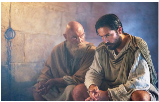
ജെയിംസ് ഫോൾക്കനർ, ജിം കാവിസൽ

കാലിഫോർണിയ: അപ്പോസ്തോലനായ പൗലോസിന്റെ ജീവിത ചരിത്രം വെള്ളിത്തിരയിലൂടെ ലോകത്തെ ജനഹൃദയങ്ങളിലേക്കെത്തിക്കാനായി നിർമ്മിച്ച 'പൗലോസ്, ക്രിസ്തുവിന്റെ അപ്പോസ്തോലൻ' എന്ന ഡ്രാമ സിനിമ റിലീസ് ചെയ്തു. മാർച്ച് 23-ന് അമേരിക്കയിലെ തീയറ്ററുകളിൽ പ്രദർശനം തുടങ്ങി. ഈ സിനിമയിൽ പ്രധാനമായും രണ്ടു കഥാപാത്രങ്ങളാണുള്ളത്. പൗലോസും പൗലോസിന്റെ സ്നേഹിതനും അപ്പോസ്തോല പ്രവർത്തകളുടെ പുസ്തകം രചിച്ച വൈദ്യനായ ലൂക്കോസും. ലൂക്കോസ് പൗലോസിനെ സന്ദർശിച്ച സംഭവവും, പൗലോസിന്റെ മാനസാന്തരവും, മിഷണറി പ്രവർത്തനങ്ങളുടെ സംക്ഷിപ്ത രൂപവും, നീറോ ചക്രവർത്തിയുടെ കാലത്തെ ഇരുണ്ട തടവറയിൽ അനുഭവിച്ച യാതനകളും, പൗലോസിന്റെ മരണവും ഒക്കെ വളരെ ഹൃദയ സ്പർശമായി കോർത്തിണക്കി നിർമ്മിച്ച സിനിമയാണ് 'പൗലോസ്, ക്രിസ്തുവിന്റെ അപ്പോസ്തോലൻ' എന്ന ബിബിൾ ഡ്രാമ സിനിമ. പൗലോസ് സുവിശേഷത്തിനു ചെയ്ത സംഭാവനയും ലൂക്കോസിനെക്കുറിച്ചുള്ള ചരിത്രപരമായ കൂടുതൽ വിവരങ്ങളും സിനിമയിൽ ദൃശ്യമാണ്. സിനിമയുടെ രചനയും സംവിധാനവും നിർവ്വഹിച്ചിരിക്കു