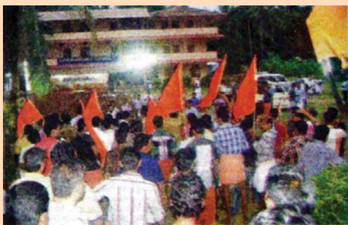
ഹിന്ദു ഐക്യവേദി പ്രവർത്തകർ കൺവൻഷൻ പന്തലിലേക്ക് ഇറച്ചുകയറുന്നു

പാലുണ്ടയിൽ ന്യൂഹോപ്പ് ബൈബിൾ കോളേജിൽ ഗോസ്പൽ ഇൻ ആക്ഷൻ പ്രസ്ഥാനത്തിന്റെ ജനറൽ കൺവൻഷനും മിഷനറി സമ്മേളനവും രാവിലെ ആരംഭിച്ചിരുന്നു. ഇതിന്റെ പൊതുസമ്മേളനം വൈകിട്ട് ആറിന് നടക്കാനിരിക്കെ 150 ഓളം വരുന്ന ഐക്യവേദി പ്രവർത്തകർ മുദ്രാവാക്യം വിളിച്ച് കൺവൻഷൻ നഗരിയിലേക്ക് ഇറച്ചുകയറുകയും അക്രമം അഴിച്ചുവിടുകയുമായിരുന്നു. ആദിവാസികളെ മതപരിവർത്തനത്തിനായി കൊണ്ടുവന്നുവെന്നും ഇവരെ തിരിച്ചയക്കണമെന്നുമായിരുന്നു ഐക്യവേദി പ്രവർത്തകരുടെ ആവശ്യം. ചിത്രീകരിച്ച മാധ്യമ പ്രവർത്തകനെ ഐക്യവേദി പ്രവർത്തകർ വളഞ്ഞിട്ട് മർദ്ദിച്ചു. എടക്കരയിലെ പ്രാദേശിക ചാനൽ സ്വന്തത്തിന്റെ റിപ്പോ