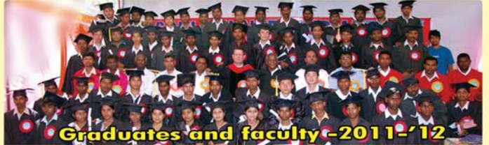
Graduates and faculty -2011-'12

OUR FEATURES • High qualified, experienced and committed faculty • Growing library • Spacious and neat dormitory • Calm and quiet campus with spiritual atmosphere • Daily spiritual activities • Free accommodation, Food and study materials • Weekend outreach ministries to the nearby cities.