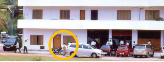
എ.ജി. കോൺഫറൻസ് സമയത്ത് പുറത്ത് പോലീസ് കാവൽ