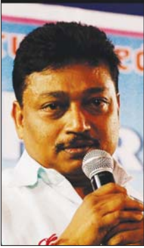
ഡോ.തുഷാർ ഭായ് ചൗധരി (കേന്ദ്ര മന്ത്രി)