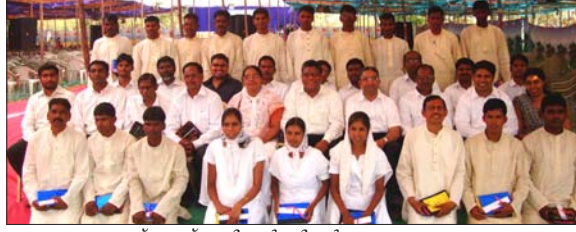
ഗ്രാജുവേറ്റ് ചെയ്ത വിദ്യാർത്ഥികൾ അദ്ധ്യാപകരോടുകൂടെ