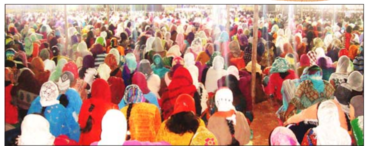
തിങ്ങി നിറഞ്ഞ കൺവൻഷൻ പന്തൽ

പ്രവർത്തിക്കുന്നതിനുള്ള ജാതി സമൂഹങ്ങളുടെ സംഗമമെന്നോ ആദിവാസി സഹോദരങ്ങളുടെ അടങ്ങാത്ത ആത്മദാഹമെന്നോ വിശേഷിപ്പിക്കാവുന്ന 8-ാമത് ഡോൾവൻ കൺവൻഷൻ സമാപിച്ചു. ഗുജറാത്തിലെ താപ്പി ജില്ലയിലുള്ള ഡോൾവനിൽ വെച്ച് നടത്തപ്പെടുന്ന ഫെലോഷിപ്പ് ആശ്രം ചർച്ച് ഓഫ് ഇന്ത്യയുടെ വാർഷിക കൺവൻഷനാണ് ഡോൾവൻ കൺവൻഷൻ