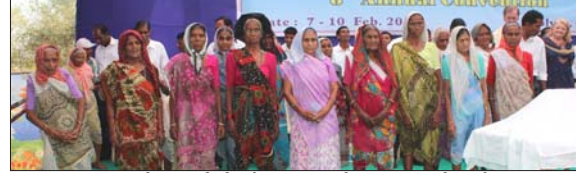
സഭയിലെ സീനിയർ സഹോദരിമാരെ ആദരിക്കൽ