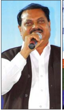
ശ്രീ.പുനാജി ഗാമിത് എം.എൽ.എ. (വ്യവസായ)