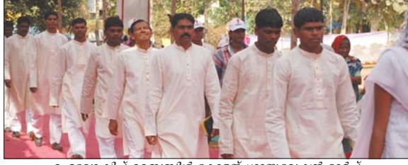
ഫെലോഷിപ്പ് ബൈബിൾ കോളജ് ഗ്രാജുവേഷൻ മാർച്ച്