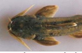
മാവേലിക്കര : പാറക്കുറി വർഗ്ഗത്തിലുള്ള അപൂർവ്വയിനം മത്സ്യത്തെ കണ്ടെത്തി. മണിമല നദിയുടെ ഉത്ഭവ സ്ഥാനത്തിനടുത്തുള്ള ഇടുക്കി ജില്ലയിലെ ഇളംകാടൻ നിന്നാണ് ശാസ്ത്ര ലോകത്തേക്ക് പുതിയ മത്സ്യം എത്തുന്നത്. ഗ്ലിപെറ്റൊറാക്സ് ഇളംകാടൻസിസ് എന്ന് നാമകരണം ചെയ്യപ്പെട്ടിരിക്കുന്ന മത്സ്യം സൈസോറിയേല മത്സ്യ കുടുംബത്തിൽപ്പെടുന്നു.

കളും മുതുച്ചിറകിലെ ഏഴു മുതൽ ഒൻപത് വരെ വരുന്ന കിരണങ്ങളും ഇവയെ തിരിച്ചറിയാൻ സഹായകമാണ്. ആഴം കുറഞ്ഞതും നല്ല ഒഴുക്കുള്ളതുമായ പാറക്കെട്ടുകൾ നിറഞ്ഞ ഉയർന്ന പ്രദേശങ്ങളിലെ അസ്പഷ്ടമായ ഇവയുടെ വാസം. പകൽ സമയങ്ങളിൽ പാറക്കെട്ടുകൾക്കിടയിൽ ഒളിച്ചിരിക്കുന്നതുകൊണ്ടാവാം ഇതുവരെ ഇവ മുഴു ശാസ്ത്രജ്ഞന്മാരുടെ ദൃഷ്ടിയിൽപ്പെടാതെ പോയത്. 2010 ൽ ഇടുക്കിയിൽ നിന്ന് പിടിച്ചെടുത്ത ഈ മത്സ്യം പുതിയതാണെന്ന് തോന്നിയതിനാൽ കുടുതൽ ശാസ്ത്രീയ പഠനങ്ങൾ നടത്തുകയും കൽക്കട്ട, ചെറുന, കോഴിക്കോട് തുടങ്ങിയ സ്ഥലങ്ങളിലെ നാഷണൽ മ്യൂസിയങ്ങളിൽ നിക്ഷേപിക്കപ്പെട്ടിരിക്കുന്ന സമാന മത്സ്യങ്ങളുമായി താരതമ്യപഠനം നടത്തുകയും തുടർന്ന് എഴുതിയ Glyptothorax Elankadensis, A New Species of fish from Manimala River, Kerala എന്ന്