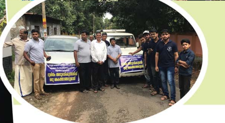
ദുരിതാശ്വാസം: പ്ലാപ്പുള്ളി സഭ