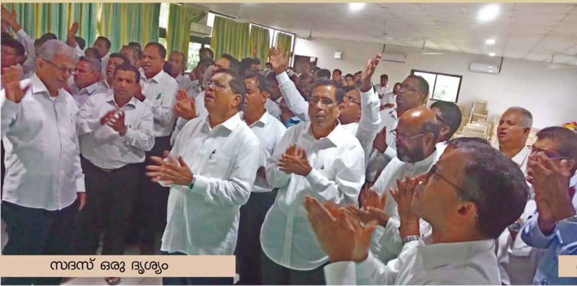
സഭസ് ഒരു ദൃശ്യം