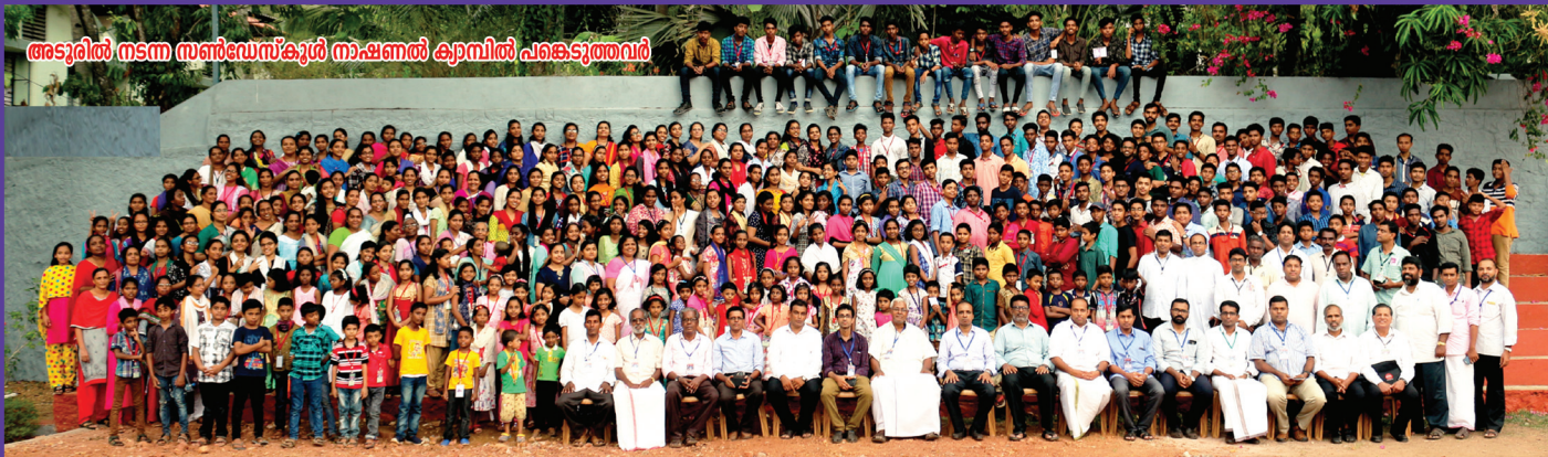
അടുരിൽ നടന്ന സൺഡേസ്കൂൾ നാഷണൽ ക്യാമ്പിൽ പങ്കെടുത്തവർ