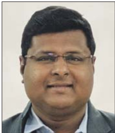
ജെ പി വെണ്ണിക്കുളം