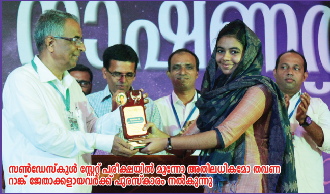
സൺഡേസ്കൂൾ സ്റ്റേറ്റ് പരിഷ്കരണത്തിൽ മുന്നോട്ടുവന്ന അതിലധികമോ തവണ നാക് ജേതാക്കളായവർക്ക് പുരസ്കാരം നൽകുന്നു