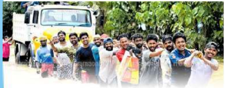
കേരളത്തിനായി നമുക്ക് പ്രാർത്ഥിക്കാം. ഐക്യമായി പ്രവർത്തിക്കാം

യൂണിവേഴ്സിറ്റിയിലെ എം.ഫിൽ ക്ലിനിക്കൽ സൈക്കോളജി വിദ്യാർത്ഥിയുമാണ്.