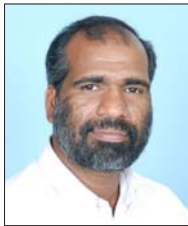
സാറാ റ്റി. മുഖത്തല

ബൈബിൾ മനുഷ്യരുമായി ചേർന്നു നിൽക്കുകയും മനുഷ്യന്റെ കാറ്റലോഗ് ആയ തുകൊണ്ട് ബൈബിൾ സത്യം തന്നെയാണ്. എല്ലാ തിരുവെഴുത്തും ദൈവശാസനമാണ്. (2 തിമൊ.3: 15). “ആദിയിൽ വചനം ഉണ്ടായിരുന്നു; വചനം ദൈവമായിരുന്നു, വചനം ദൈവത്തോടു കൂടെയായിരുന്നു, ആ വചനം കൃപയും സത്യവും നിറഞ്ഞ ഭൂമിയിൽ പാർത്തു” (യോഹ. 1:1). സ്വർഗത്തിൽ എന്നേക്കും സ്ഥിരമായിരിക്കുന്നതാണ് ദൈവവചനം. ഈ വചനം വായിക്കുന്നവനും വായിച്ചു കേൾപ്പിക്കുന്നവനും പ്രമാണിക്കുന്നവനും ഭാഗ്യവാൻ (വെളി. 1:3). ഇങ്ങനെയുള്ള ഈ തിരുവെഴുത്തിൽ കുടുംബത്തെ കുറിച്ചും, എങ്ങനെ