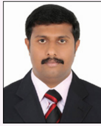
ജോൺസി കടമ്മനിട്ട ചീഫ് എഡിറ്റർ

അ പ്കോൺ വോയ്സിന്റെ മാനുവായനക്കാർക്ക് യേശുക്രിസ്തുവിന്റെ നാമത്തിൽ സ്നേഹവന്ദനം.