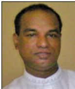
പാ.ജോൺസൺ ബേബി അസോ. കോർഡിനേറ്റർ