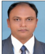
പാ. ഗിൾബർട്ട് ജോർജ്ജ് ഷാർജ്ജ - സെന്റർ മിനിസ്റ്റർ