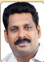
അജി കല്ലുകൾ (വൈസ് ചെയർമാൻ)