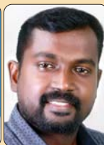
ബിബിൻ കല്ലുകൾ (അസോ. എഡിറ്റർ)