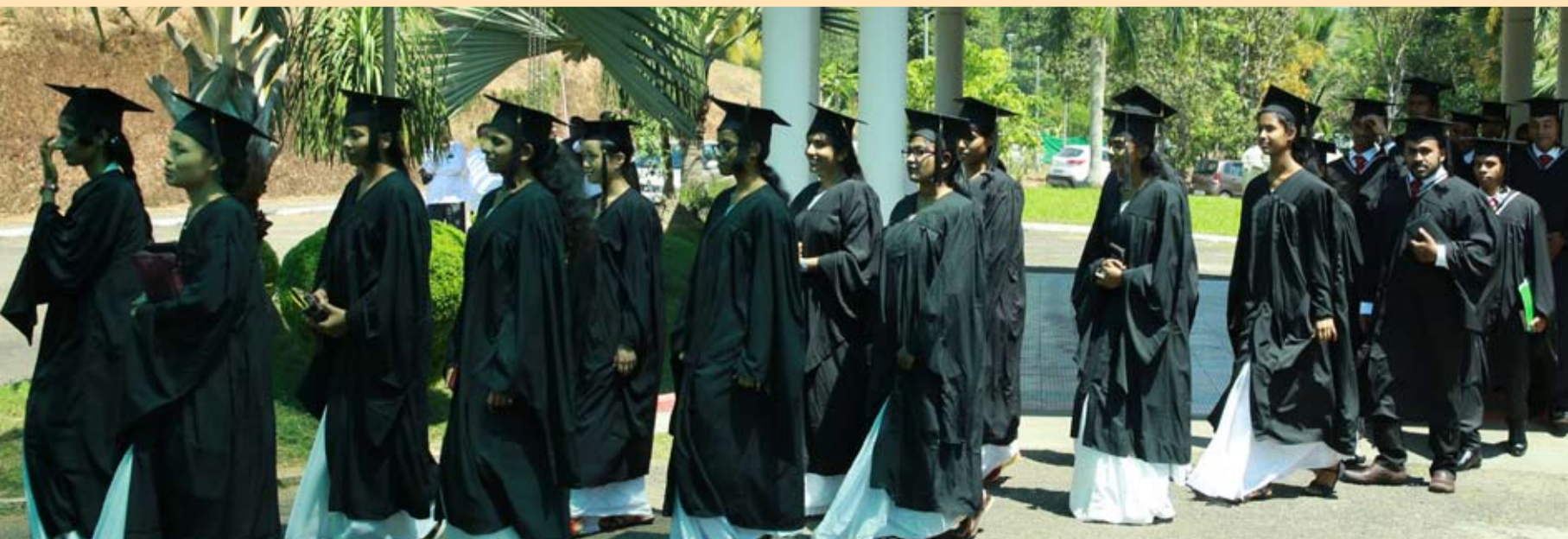
ഗ്രാഡുവേറ്റ്സ് മാർച്ച് പാസ്റ്റ് (പെൺകുട്ടികൾ)

കുടുംബജീവിതത്തിന്റെ വിജയത്തിലും പരാജയത്തിലും സ്ത്രീയുടെ പങ്ക് വലിയതാണ്. യേശുക്രിസ്തുവിന്റെ കാലത്ത് യെഹൂദ സ്ത്രീകൾക്ക് ആലയത്തിലും സിനഗോഗുകളിലും ആരാധനയിൽ വലിയ പങ്കൊന്നും വഹിക്കാൻ അവകാശം ഇല്ലായിരുന്നു. വേദപുസ്തകത്തിന്