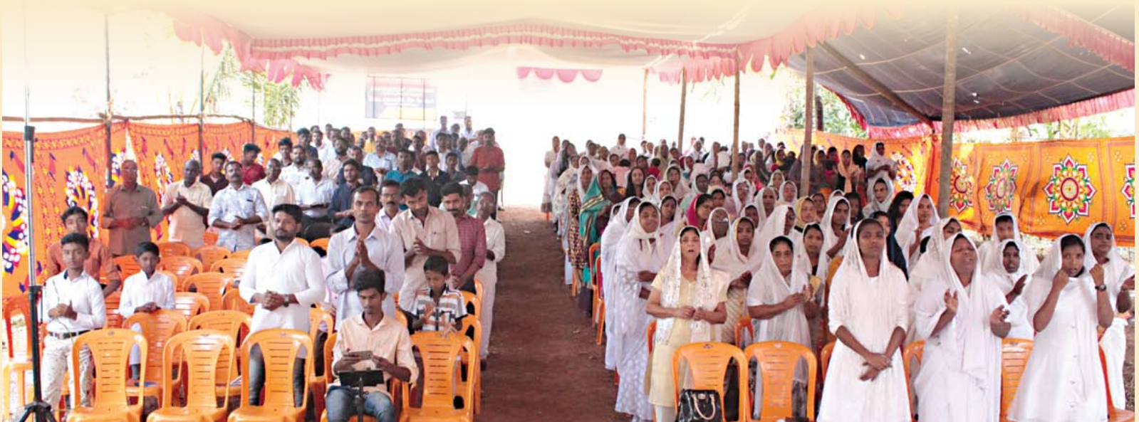
അട്ടപ്പാടി സെന്ററിലുള്ള വിവിധ സഭകളിൽ നിന്നുള്ള വിശ്വാസികൾ തിരുവത്താഴ ശുശ്രൂഷയിൽ പങ്കെടുക്കുന്നു