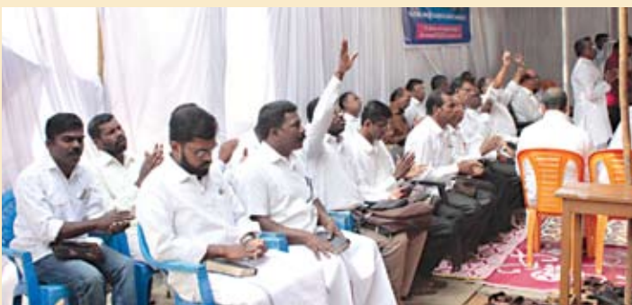
അട്ടപ്പാടിയിലെ വിവിധ സഭകളിൽ നിന്നെത്തിയ പാസ്റ്റർമാർ വേദിയിൽ