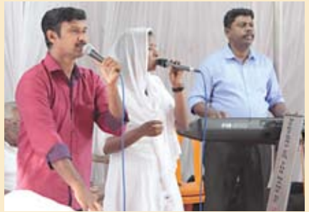
ഗോസ്പൽ സിംഗേഴ്സ്, തൃശ്ശൂർ