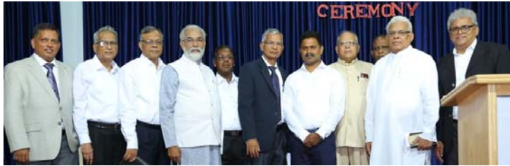
ബാംഗ്ലൂർ എബനേസർ കോളേജ് ഓഫ് ബിസിനസ്സ് സ്റ്റുഡീസ് ഉദ്ഘാടന സമ്മേളനത്തിൽ പങ്കെടുത്ത പെന്തക്കോസ്ത് സഭാ നേതാക്കളും വേദ അദ്ധ്യാപകരും.