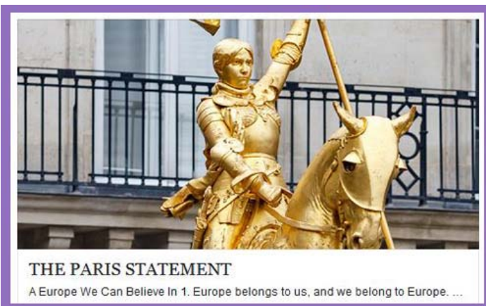
THE PARIS STATEMENT