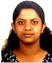
എ പ്ലസ് നേടി

2019 ജനുവരിയിൽ നടക്കുന്ന കുന്വനാട് കൺവൻഷനു അവാർഡുകൾ വിതരണം ചെയ്യും.