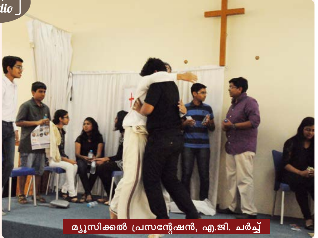
മ്യൂസിക്കൽ പ്രസന്റേഷൻ, എ.ജി. ചർച്ച്