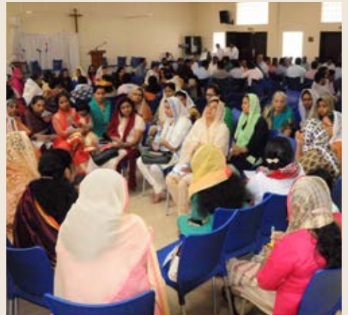
ഗ്രൂപ്പ് തിരിഞ്ഞുള്ള ചർച്ചകളിൽ നിന്ന്