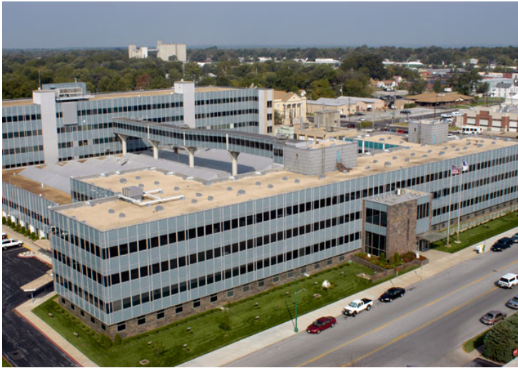
Assemblies of God International Headquarters, Springfield Missouri

New numbers released by the AG recently detail the multiple areas of growth from 2012 to 2013. The largest gain was made among water baptism, which rose 4.3%. Other notable statistics include the following: