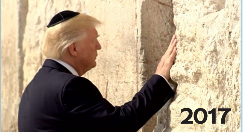
അമേരിക്കയുടെ പ്രസിഡന്റ് ഡൊണാൾഡ് ട്രംപ് യെരൂശലേമിലെ പടിഞ്ഞാറേ മതിലിൽ കൈവെച്ച് പ്രാർത്ഥിക്കുന്നു