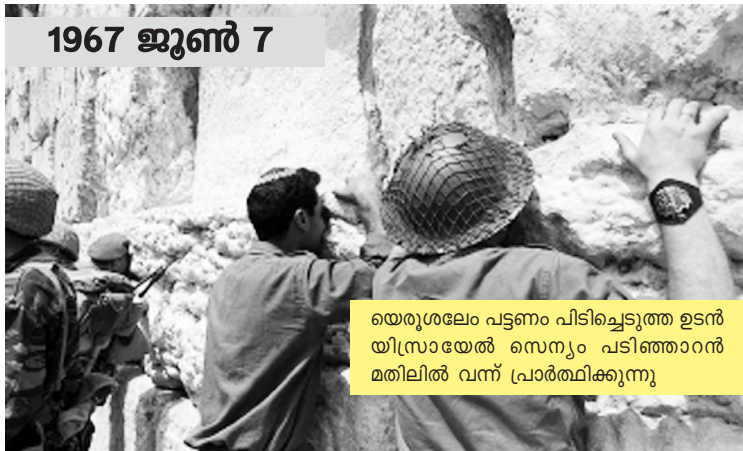
1967 ജൂൺ 7

യഹൂദന്റെ നിത്യതലസ്ഥാനം കൂടിയാണ്. ആയിരക്കണക്കിനു വർഷങ്ങൾ പ്രവാസത്തിലായിരുന്ന ജൂതന്മാർ ഒടുവിൽ അവരുടെ വീട്ടിൽ തിരിച്ചെത്തി.” യു.എസ് പ്രതിനിധി സഭയുടെ പ്രഭാഷകനായ പോൾ റയാൻ പറഞ്ഞു. യെരൂശലേമിലേക്ക് യു.എസ് എംബസി മാറ്റിസ്ഥാപിക്കുവാൻ യിസ്രായേൽ നെസറ്റ് സ്പീക്കർ യൂലി ഏഡൽസ്റ്റൈൻ യു.എസ് കോൺഗ്രസിനോട് ആവശ്യപ്പെട്ടു. യെരൂശലേമിന്റെ പുനഃരധിവാസത്തിനു ശേഷം ആദ്യമായി യു.എസ് കോൺഗ്രസുമായി നടന്ന സംയുക്ത സമ്മേളനം വളരെ പ്രാധാന്യത്തോടെയാണ് ലോകം വീക്ഷിക്കുന്നത്. ഇതിനിടെ പ്രകോപനപരമായ പ്രസ്താവനയുമായി തുർക്കി പ്രസിഡന്റ് രംഗത്തെത്തി. “യെരൂശലേമിൽ ലോകമെങ്ങുമുള്ള മുസ്ലീങ്ങൾ ജലപ്രവാഹംപോലെ സന്ദർശനത്തിന് എത്തണമെന്നും ജൂതരുടെ അധിനിവേശത്തിനു അറുതിവരുത്തണമെന്നും യെരൂശലേമിലെ അറബികൾക്ക് പിന്തുണ നൽകണമെന്നും” മായിരുന്നു പ്രസിഡന്റ് എർദോഗന്റെ പ്രസ്താവന. “യെരൂശലേം പട്ടണത്തിലെ ഓരോ കോണുകളിലും യെഹൂദന്റെ വേരുകളാണുള്ളതെന്ന് പറഞ്ഞ് യെരൂശലേം മേയർ നീർബാർകെന്റ് എർദോഗന്റെ വാക്കുകളെ പുച്ഛിച്ചുതള്ളി.