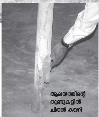
ആലയത്തിന്റെ തുണുക്കളിൽ ചിതൽ കയറി

തമിഴ്നാട്ടിലെ പാപ്പാക്കുഡയിലുള്ള നമ്മുടെ ആരാധനാലയത്തിന്റെ ഓലയും മരത്തുണുക്കളും ചിതൽക്കയറി ദ്രവിച്ചു. സൈഡുകൾ ഓലകൊണ്ട് മറച്ചു. ആലയത്തിൽ ഉള്ളിലുള്ള മരത്തുണുക്കളിലാണ് ചിതൽ കയറിയത്. കീടനാശിനി കൊണ്ടൊന്നും ചിതൽ മാറിയില്ല. എത്രയുംവേഗം ഈ ആലയം പുതുക്കി പണിയേണ്ടത് അത്യാവശ്യമായിരിക്കുന്നു. സൈഡുകൾ ചെങ്കല്ലുകൊണ്ട് കെട്ടിമറച്ച് ഓലമേഞ്ഞ് പണിയണമെന്നാണ് ആഗ്രഹിക്കുന്നത്. മരത്തുണുകൾ മാറ്റിയിട്ട് ഇരുമ്പു തുണുകൾ പിടിപ്പിക്കേണ്ടതുണ്ട്. ആലയത്തിന്റെ പുന:നിർമ്മാണത്തിനായി നാൽപ്പത്തയ്യായിരം രൂപയോളം നമുക്കു ആവശ്യമാണ്.