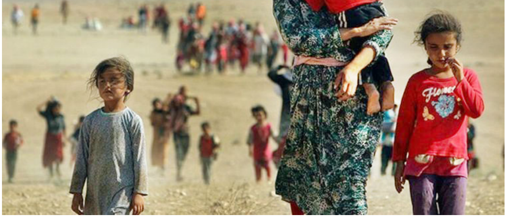
ഏറെ ക്രൈസ്തവർ സിറിയ വിട്ടു