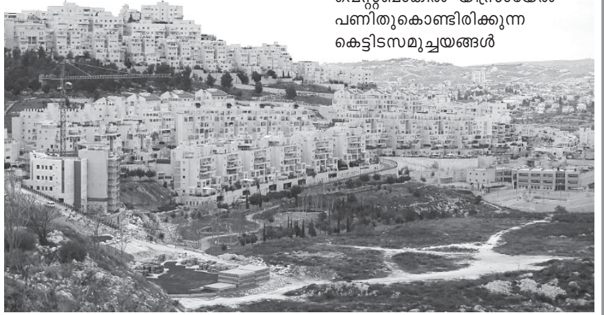
വെസ്റ്റ്ബാങ്കിൽ യിസ്രായേൽ പണിതുകൊണ്ടിരിക്കുന്ന കെട്ടിടസമുച്ചയങ്ങൾ

ലോകമെങ്ങും അധിവസിക്കുന്ന യെഹൂദാജനം യിസ്രായേലിലേക്ക് അലിയയായി (വാഗ്ദത്തനാട്ടിലേക്കുള്ള ജൂതരുടെ കുടിയേറ്റത്തിനു പറയുന്ന ഏബ്രായാ പേര്) കടന്നുവരുന്നത് വർദ്ധിച്ചിരിക്കുന്നതിനാൽ അവർക്കായുള്ള താമസസൗകര്യം ഒരുക്കേണ്ടത് യിസ്രായേലിനെ സംബന്ധിച്ച് അത്യാവശ്യമായ കാര്യമാണ്. വെസ്റ്റ്ബാങ്കിലും യിസ്രായേലിന്റെ മറ്റു ഭാഗങ്ങളിലും യിസ്രായേൽ ഒട്ടനവധി പാർപ്പിടസമുച്ചയങ്ങൾ കടന്നുവരുന്ന ജൂതർക്കായി നിർമ്മിച്ചുകൊണ്ടിരിക്കുകയാണ്. വെസ്റ്റ്ബാങ്കിൽ മാത്രം 4,20,000 പേർക്ക് അധിവസിക്കുവാനുള്ള സൗകര്യമാണ് യിസ്രായേൽ ഒരുക്കിയിട്ടുള്ളതെന്ന് യെഷ്വാ കൗൺസിൽ പറയുന്നു. പാർപ്പിടസമുച്ചയ നിർമ്മാണം നിർവ്വഹിക്കാനും നടത്തപ്പെടേണ്ടതിനായി പ്രാർത്ഥിക്കണം.