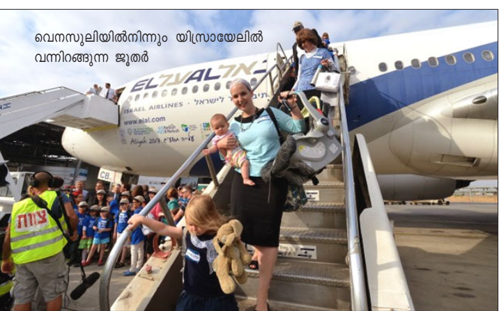
വെനസുലയിൽനിന്നും യിസ്രായേലിൽ വന്നിറങ്ങുന്ന ജൂതർ