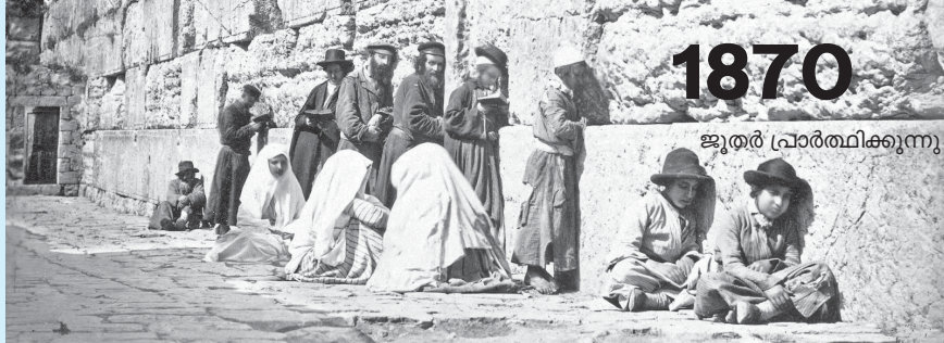
1870 ജൂതർ പ്രാർത്ഥിക്കുന്നു

റോമൻ ചക്രവർത്തി ടൈറ്റസ് ഫ്ലാവിയസ് യെരൂശലേം ദൈവാലയം തകർത്തു. ഹെരോദാവ് മനോഹരമായി പണിത ദൈവാലയത്തിനെ കല്പ് കല്ലിന്മേൽ ശേഷിക്കാതെവണ്ണം അടിസ്ഥാനങ്ങളൊക്കെ ഇളക്കിയെടുത്തു. എന്നാൽ പടിഞ്ഞാറേ മതിൽ തകർത്തില്ല. ഇന്ന് ജൂതർ ഇവിടെ നിന്നാണ് തല മതിലിൽ ഇടിച്ചു മശിഹായുടെ വരവിനായി പ്രാർത്ഥിക്കുന്നത്. മതിലിന്റെ വിടവുകൾ പ്രാർത്ഥനാ വിഷയം എഴുതി തിരുകിവെക്കുകയും ചെയ്യുന്നു. അമേരിക്കൻ പ്രസിഡന്റ് ട്രംപ് ഈ മതിലിങ്കൽ ചെന്ന് പ്രാർത്ഥിച്ച സംഭവം ലോകശ്രദ്ധ പിടിച്ചുപറ്റിയിരുന്നു.