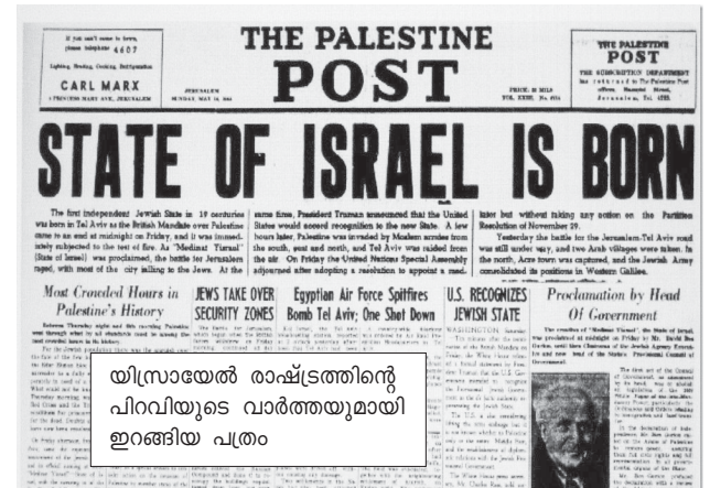
യിസ്രായേൽ രാഷ്ട്രത്തിന്റെ പിറവിയുടെ വാർത്തയുമായി ഇറങ്ങിയ പത്രം

തിരിച്ചു വരികയില്ലെന്നാണ്. എന്നാൽ ആയിരക്കണക്കിനു വർഷങ്ങൾക്കു മുമ്പ് യേശുപ്രവാചകൻ വിളിച്ചു പറഞ്ഞു. ഈ വക ആർ കേട്ടിട്ടുള്ളു? ഇങ്ങനെയുള്ളത് ആർ കണ്ടിട്ടുള്ളു? ഒരു ദേശം ഒരു ദിവസം കൊണ്ടുപിറക്കുമോ? ഒരു ജാതി ഒന്നായിട്ടു തന്നെ ജനിക്കുമോ? (യെശ.66:8). യിസ്രായേലിനെ തിരഞ്ഞെടുത്ത ലോകനേതാക്കളെ ഭയപ്പെടുത്താൻ വിധി ആ വചനത്തിന്റെ സാക്ഷാത്കാരം 1948 മെയ് 14-നു സംഭവിച്ചു. യിസ്രായേൽ പിറന്നു State Of Israel Is Born എന്ന തലക്കെട്ടോടെയാണിത്. തുടർന്ന് യിസ്രായേലിന് ശത്രുക്കൾക്കെതിരെ ജയത്തിന്റെ ജൈത്രയാത്രയായിരുന്നു.