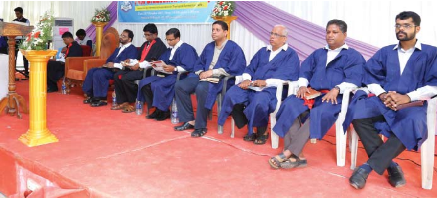
കോളേജ് അധ്യാപകരിൽ ചിലർ