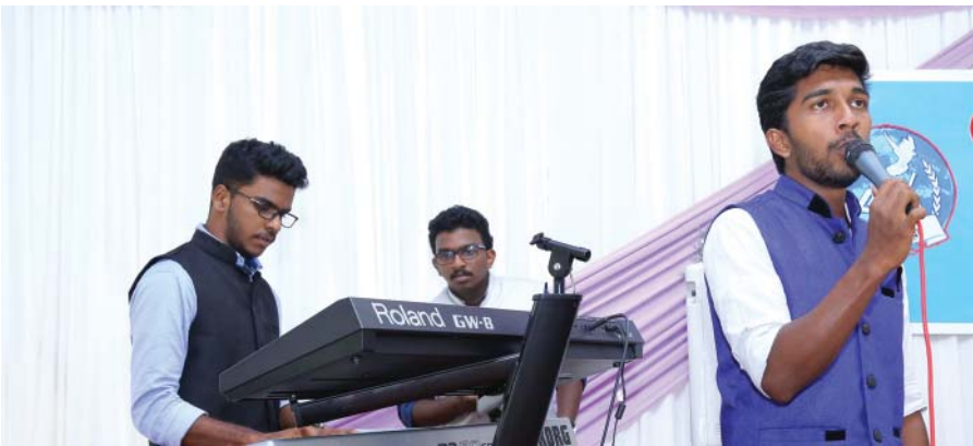
ആരാധനയ്ക്ക് നേതൃത്വം കൊടുക്കുന്നു.