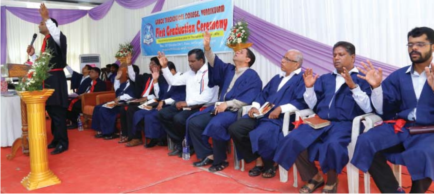
നടത്തിയ ദൈവത്തിനു ഒരായിരം നന്ദി അർപ്പണവുമായി