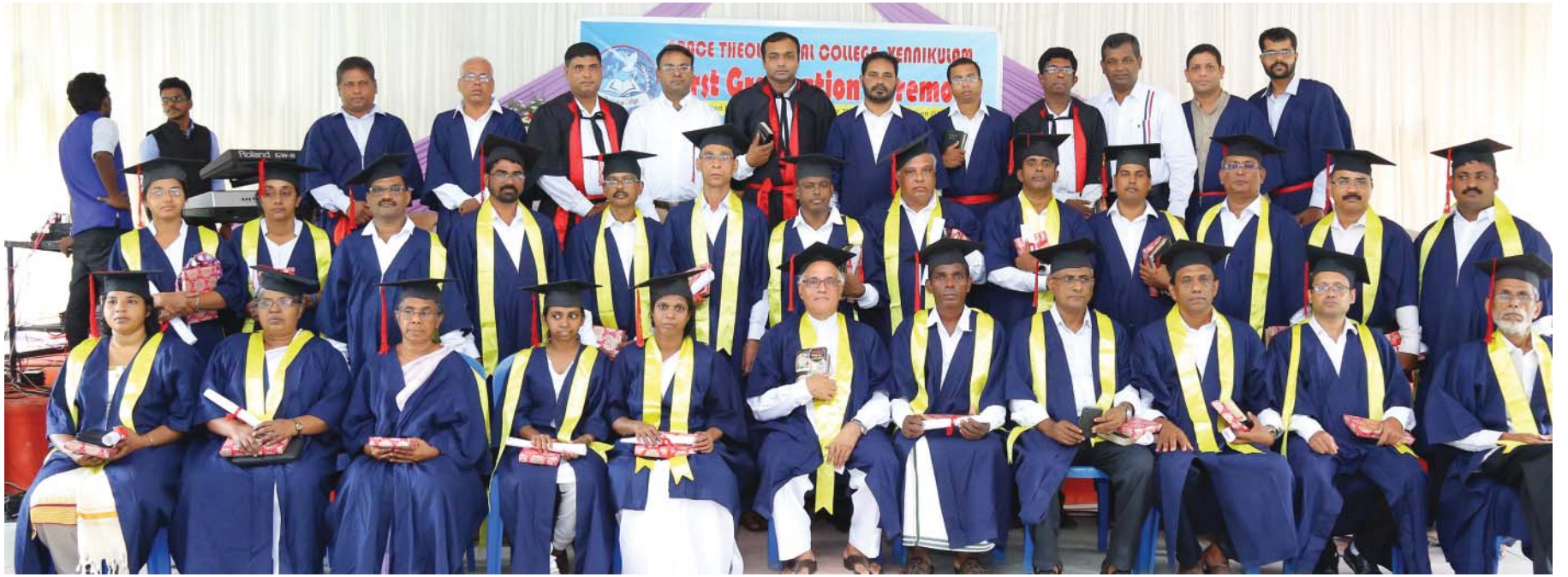
ഗ്രെയ്സ് തിയോളജിക്കൽ കോളേജിൽ നിന്നും (2017) ഈ വർഷം ഗ്രാജുവേറായ വിദ്യാർത്ഥികൾ അദ്ധ്യാപകർക്കൊപ്പം

വെണ്ണിക്കുളം: ഗ്രെയ്സ് തിയോളജിക്കൽ കോളേജിന്റെ കറസ്പോണ്ടൻ വിദ്യാർത്ഥികളുടെയും വിവിധ സെന്ററുകളുടെയും ഒന്നാമത് ഗ്രാജുവേഷൻ കഴിഞ്ഞ ഒക്ടോബർ 31-ന് വെണ്ണിക്കുളം ഗോസ് പൽ സെന്റർ ചർച്ച് ഓഡിറ്റോറിയത്തിൽ പകൽ 10 മുതൽ 1 മണിവരെ